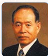
Ryoji Noyori (Organometallic Chemistry) Japan