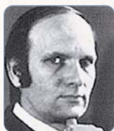
John R. Schrieffer (Physics) U.S.A.