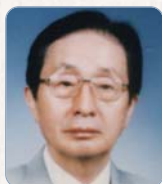
金容稷 (韓國現代文學)