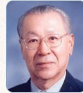
金商周 (32~33代, 2008~2012)