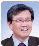
李泰鎭 (韓國政治社會史)