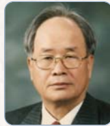
白完基 (韓國行政 吳 行政文化)