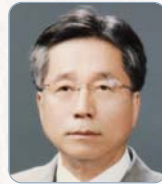
李正馥 (現代韓國政治)