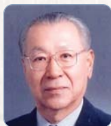
金商周 (金屬材料工學)