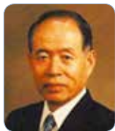
Ryoji Noyori (Organometallic Chemistry) Japan