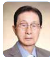
金容稷 (韓國現代文學)