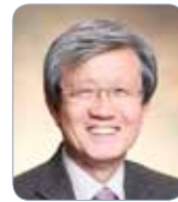
李泰鎭 (韓國政治社會史)