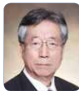
李正馥 (現代韓國政治)