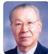
金商周 (32~33代, 2008~2012)