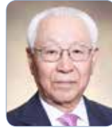
金商周 (金屬材料工學)