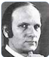
John R. Schrieffer (Physics) U.S.A.